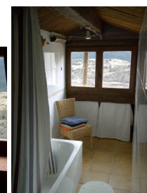
- Vistas - sofá cama montado - general - camas individuales - detalle - baño